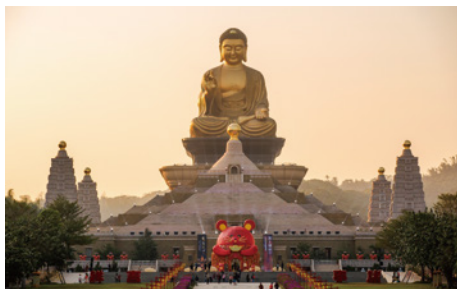
Fo Guang Shan Buddha Museum 佛光山佛陀紀念館