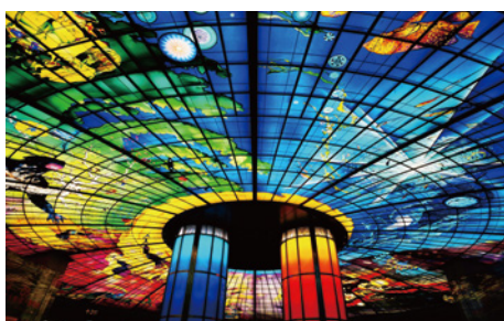
Dome of Light 光之穹頂