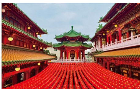
Sun Fong Temple 三鳳宮