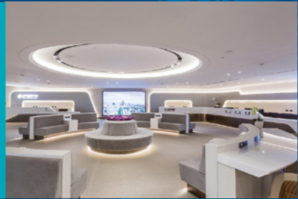
2F Visitor Information Center