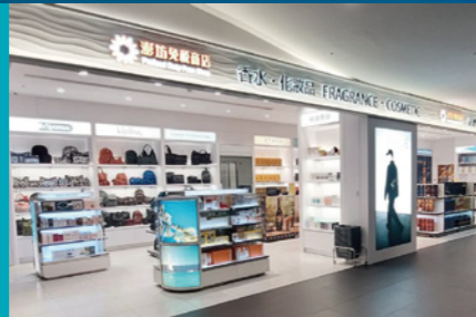
2F Duty Free Shop