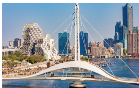
Great Harbor Bridge 大港橋