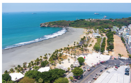
Cijin Island 旗津