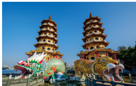
Lotus Pond / Dragon Tiger Tower 蓮池潭 / 龍虎塔