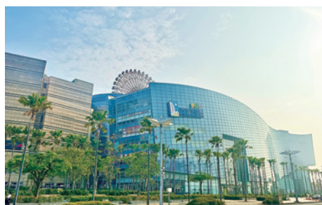
Dream Mall 夢時代購物中心