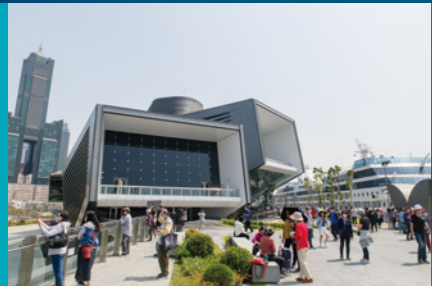
3F Rhythm of the Sea Plaza