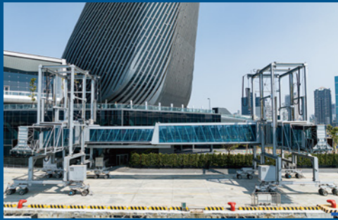
Passenger Boarding Bridges