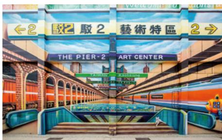
The Pier-2 Art Center 駁二藝術特區