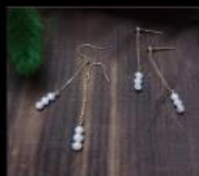
a little cool DESIGN 永生花與珍珠手作設計飾品 Accessories