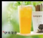
伊佐茶序 嚴選品質的好茶味 Tea Shop