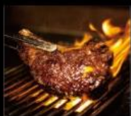
比爾比夫阿根廷烤肉 阿根廷烤肉 Beef