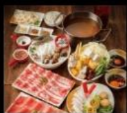
泰山汕頭火鍋 高雄在地40年汕頭火鍋 Traditional Hot Pot