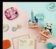
棧時旅行 旅人生活質感選物 Travel & Life