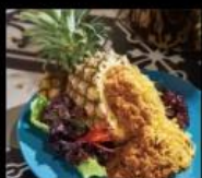
WOO Taiwan 正宗清邁視覺系料理 Thai Cuisine