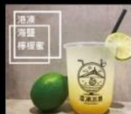
港凍冰果 鮮打果汁 雪花冰專賣 Fruit Juice