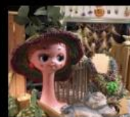
雙重人格 民族風格特色小舖 Accessories