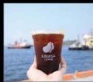
路易莎咖啡 精品咖啡平價化第一品牌 Coffee & Dessert