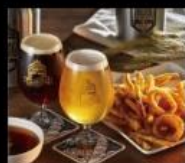
掌門精釀啤酒餐廳 台灣在地36款精釀啤酒 Brewery Restaurant