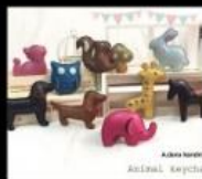
客以樂 以喜樂製作·客以此為樂 Accessories