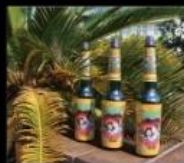
棧棧好物 嚴選台灣經典創意品牌 Life Goods