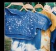
自在染 在地純天然植物手染服飾 Handicraft