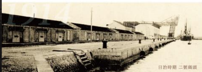
日治時期 二號碼頭

Kaohsiung Port Warehouse No.2 (KW2) was a small warehouse built with bricks and a tile roof in 1914 (3rd year of the Taisho regime) dedicated to storing sugar for export. Blown down by the US bombard during WWII, the KMT government re-built the warehouse in 1962 with reinforced concrete pillars and a rebar structure. The interior containing no column is the most spectacular view of this warehouse that has witnessed the economic takeoff of Taiwan. In 2003, the Kaohsiung City Government thus announced it a historical building.