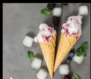
貝力阿法式冰淇淋 天然水果法式冰淇淋 French Ice Cream