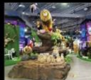
化石先生 HANSA PARK 最專業的古生物清修團隊 Souvenirs