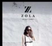
ZOLA SELECT SHOP 美好生活的提案選物店 Ladies' Fashion