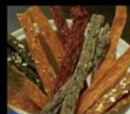
寵愛牠 好品質寵物用品 Pets Shop