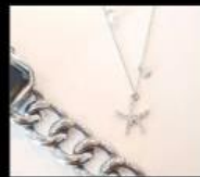
GiFT+ 銀飾卡片 Souvenir