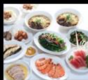
小紅麵店 國宴級紅毛港餐廳 Taiwanese Cuisine