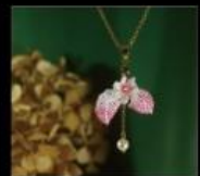
水簫絲 用形與色妝點精采生活 Home Accessories