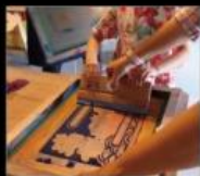
山津塢 傳統大漁旗在地文化體驗 Handicraft