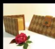
達原良生活小舖 以紙纖微編織的環保生活用品 Life Goods