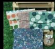
西瓜手作 客製化布類手作 Groceries