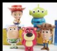
集客玩 潮流玩具模型專賣店 Toys