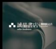
誠品書店 體驗閱讀生活美好 Bookstore