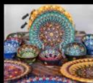
伊斯坦堡市集 土耳其特色工藝品 Home Deco.