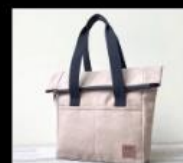
琥珀帆布 帆布文創商品製造工廠 Tote Bags