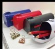
101 expo 台日質感文具選物專賣店 Stationery