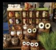
貓頭鷹森林 貓頭鷹與貝殼之手作與選品 Groceries