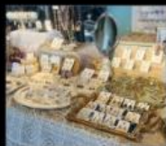
KROSA 輕奢散點 Accessories