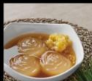
小本愛玉 台東屏東純天然手洗愛玉 Ice Jelly(AiYu)