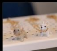
Yunique Backyard 獨一無二的純手工法彫飾品 Accessories