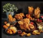
雞啖咕啖美式炸雞 堅持雞肉品質 吃得安心 Fried Chicken