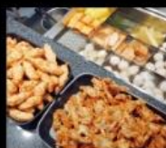
國民市場魚丸料理 老字號48年魚丸名店 Fish Ball Cuisine