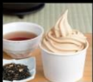
香茗茶行 傳承七十年的茶飲老味道 Tea Shop