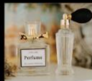
CHIN CHIN Perfume 調製自己的香水很簡單 Perfume