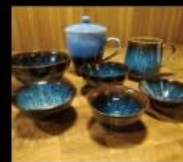
幸福的青島 平價美學商品 Groceries