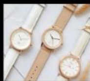
W.wear 一支能穿搭的手錶 Accessories