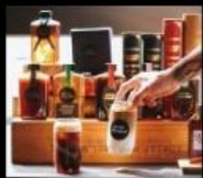
質介急送 微氣泡飲外帶專門店 Coffee & Dessert