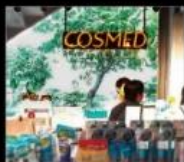
康是美 價格要美·先康是美 Cosmetic and Pharmacy