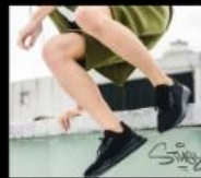
昂路名鞋館 台灣最大世界名鞋連鎖 Shoes Shop