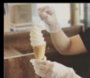
酷礦美式冰淇淋 100%純鮮乳手工冰淇淋 Ice Cream