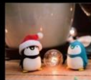
TenTen小書包 滿滿創意生活得自在小窩 Life Goods