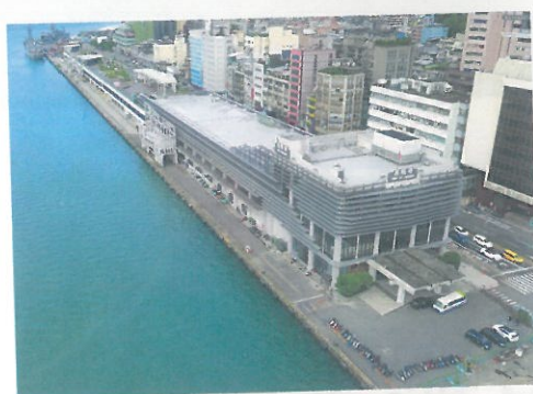
新設される基隆港のW2ターミナル(写真上)には、22万トンクラスの客船が停泊可能となる。既存のE2ターミナル(写真下は改修後イメージ)の対岸にあたり、より鉄道駅に近い

台湾クルーズの一大拠点である基隆港のターミナルで、大規模改修が進んでいる。クルーズファンにはおなじみのE2ターミナルは、2021年夏に改修が完了すると、埠頭は全長558メートル、水深9・5メ