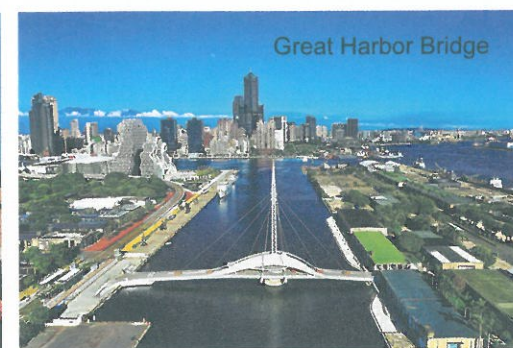
Great Harbor Bridge