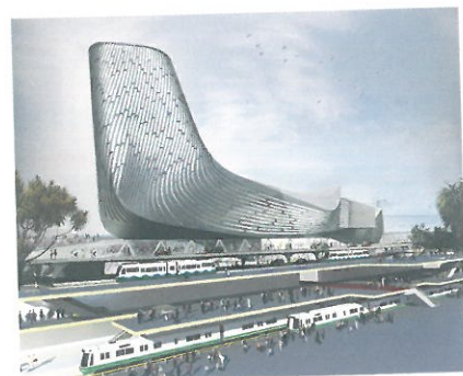
流線形の外観が印象的な高雄港のクルーズターミナル。免税店のほか、レストランやマリッジなど多彩なニーズに応えるショップが入る予定